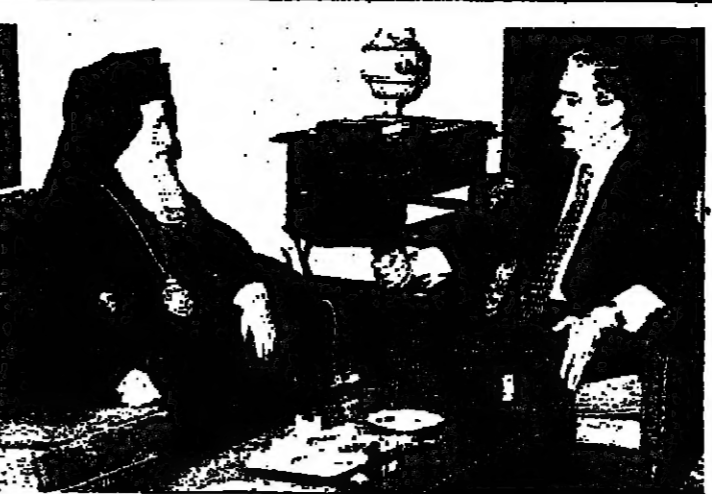
الرئيس سركيس يتحدث... (تصوير دالاتي ونبرا)

الرئيس والوزير بطرس... (تصوير دالاتي ونبرا)